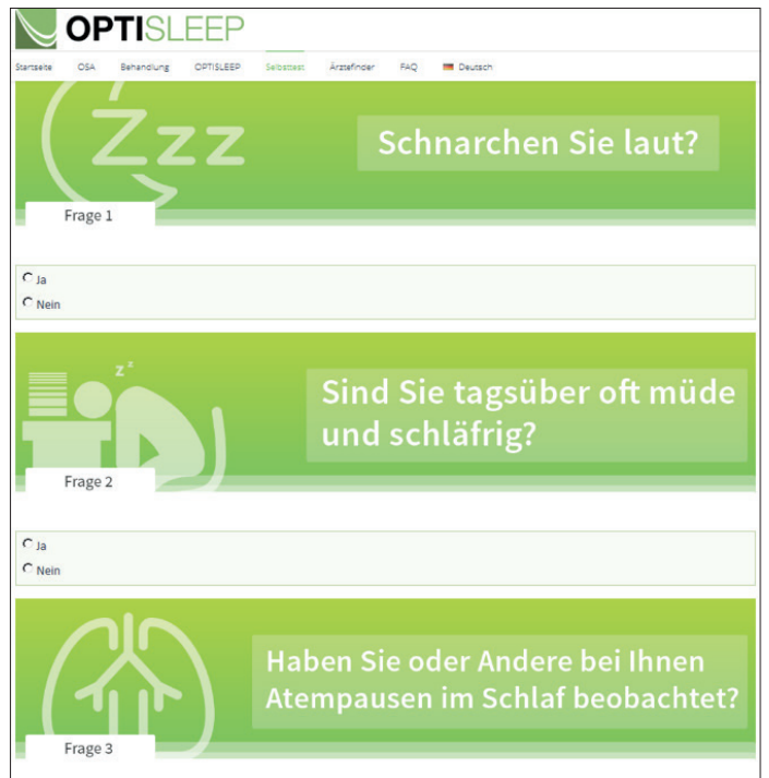
Abb. 4: Behandlungsbedürftig oder nicht? Ein Selbsttest hilft bei der Orientierung.