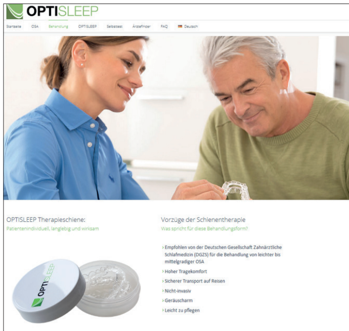
Abb. 3: Erläuterungen zur Schienetherapie erleichtern dem Patienten die Entscheidung für eine Behandlung.