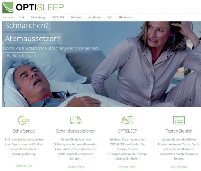
Abb. 1: Die Patientenwebsite optisleep.de ist einfach und übersichtlich aufbereitet und liefert relevante Informationen über wenige Klicks.

steht auf der Website zum Download bereit.